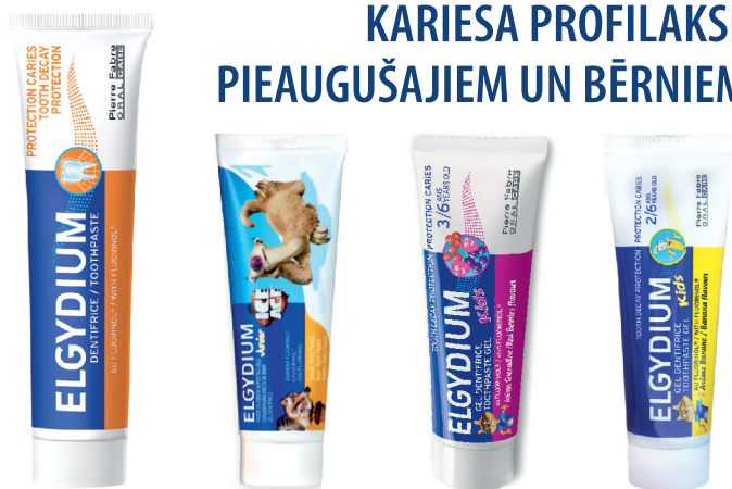
Elgydium Decay Protection, 75 ml, 1350 ppmF- Elgydium Junior Tutti Frutti, 50 ml, 1400 ppmF- Elgydium KIDS Red Berries, 50 ml, 1000 ppmF Elgydium KIDS Banana, 50 ml 500 ppmF-